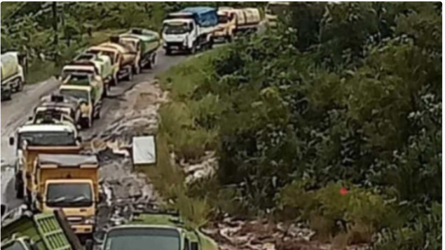
Gambar Saat Kondisi Jalan Kuala Kurun Gunung Mas

PALANGKA RAYA - Keprihatinan masyarakat Kabupaten Gunung Mas (Gumas) terhadap infrastruktur jalan yang selama ini mereka gunakan dalam aktivitas sehari - hari, belum lah selesai seperti apa yang diharapkan selama ini.